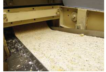
... fertig ausgewalzt fährt der Teig dann zu den Schneidwerkzeugen

schließen sich die Poren dann und die Nudeln bleiben stabiler und fester. Dadurch haben sie mehr Geschmack, mehr Biss und ein besseres Mundgefühl“, erklärt der Nudel-Fachmann