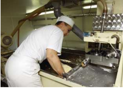
Von Hand wird der angemischte Nudelteig in die Walzmaschine gegeben ...