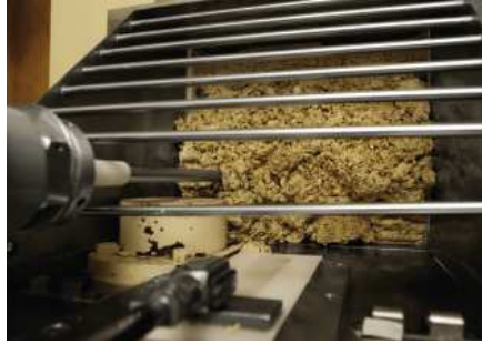
... von dort auf einem Fließband zu den Walzen transportiert ...