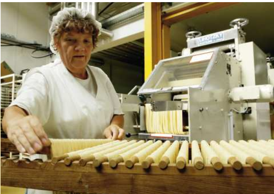
Auf Holzstäben kommen die weichen Teigstreifen aus der Walzmaschine. Eine Fabrikantin hängt die frischen Bandnudeln dann zum Trocknen auf.